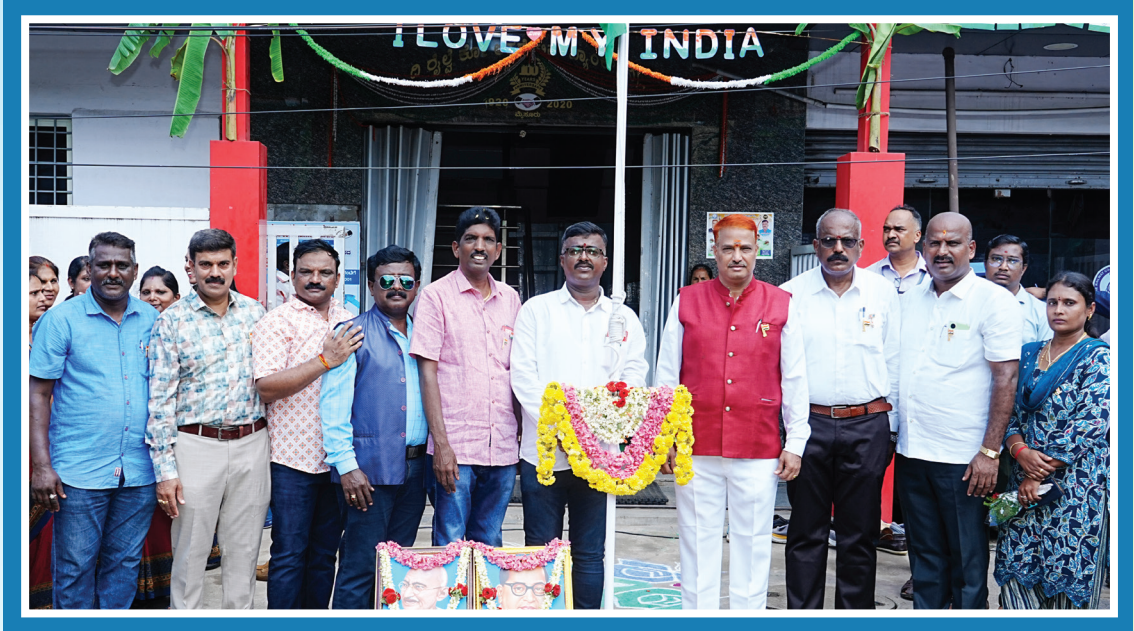
ಬ್ಯಾಂಕಿನ ವತಿಯಿಂದ 77ನೇ ಸ್ವಾತಂತ್ರ ದಿನಾಚರಣೆ ಆಚರಿಸಿದ ಸಂದರ್ಭ