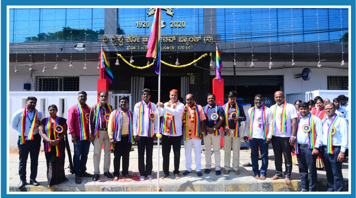
ಬ್ಯಾಂಕಿನ ವತಿಯಿಂದ 70ನೇ ಅಖಿಲ ಭಾರತ ಸಹಕಾರ ಸಪ್ತಾಹವನ್ನು ಆಚರಿಸಿದ ಸಂದರ್ಭ