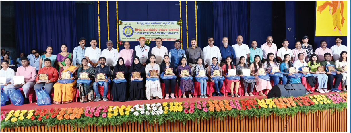
ಬ್ಯಾಂಕಿನ ಸದಸ್ಯರುಗಳ ಮಕ್ಕಳುಗಳಿಗೆ ಪ್ರತಿಭಾಪುರಸ್ಕಾರ ನೀಡಿದ ಸಂದರ್ಭ