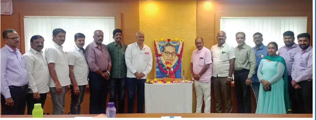
ಡಾ|| ಬಿ.ಆರ್. ಅಂಬೇಡ್ಕರ್‌ರವರ 133ನೇ ಜಯಂತಿ ಯನ್ನು ಬ್ಯಾಂಕಿನ ವತಿಯಿಂದ ಆಚರಿಸಿದ ಸಂದರ್ಭ