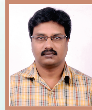
ಶ್ರೀ ಜಿ. ಎಸ್. ಕಿರಣ್‌ಕುಮಾರ್