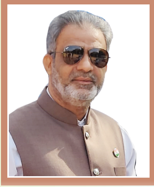
ಶ್ರೀ ಸನಲುಲ್ಲಾ ಬಾನ್